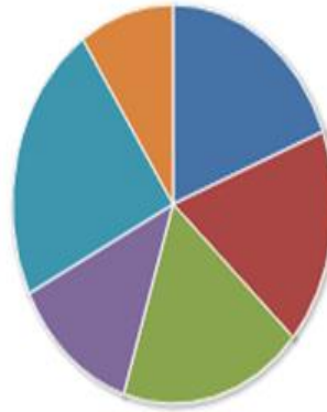
ASISTENCIAS REGISTRADAS DE LA FACULTAD DE ARTES DEL 01/01/2017 AL 30/06/2017

Se anexan a continuación los indicadores del Carnet Cultural: