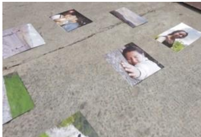
Imagen 1. Instalación de fotografías en Chía Cundinamarca Colombia, para la grabación de DesTiempo

Pero toda percepción se prolonga en acción naciente y cuando tomamos conciencia de estos mecanismos en el momento en que entran en juego, reconocemos que esta conciencia de todo un pasado de esfuerzos almacenada en el presente es una memoria, “pero una memoria profundamente diferente de la primera, tendida siempre hacia la acción, asentada en el presente y no mirando otra cosa que el porvenir. Ya no nos representa nuestro pasado, lo actúa” (Bergson, 2017, p. 96).