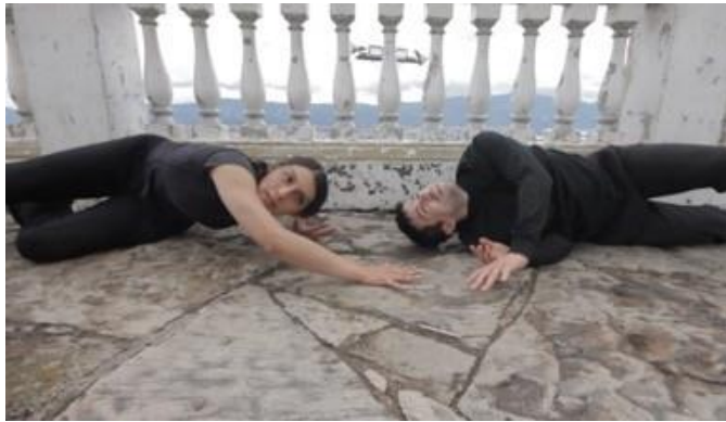
Imagen 4. Grabación de DesTiempo en iglesia de la Valvanera Chía. Cundinamarca, Colombia.

esta nueva cotidianidad se rescatara lo que hubo de potencial creativo en la experiencia misma de crear en medio de una pandemia; el arte, y este caso particular la danza abordada desde una propuesta audiovisual, cumplió especialmente con la posibilidad de comunicar, de ser expresión para los demás, dejando abierto el canal para que tanto los participantes, como los y las espectadoras desde su propia mirada, otorgaran nuevos significados, se identificaran o proyectaran contenidos de su propio mundo en la propuesta artística que se compartió. El recuerdo por su lado, al mezclarse con múltiples sentires se ligó al presente y en consecuencia se extendió desde el despliegue de los cuerpos danzantes.