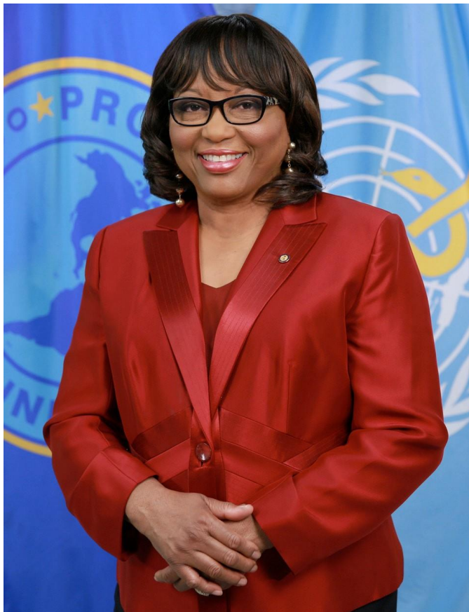
Carissa F. Etienne

Como se cita en (Etienne, 2018) “La Organización Mundial de la Salud define a la salud como un estado de completo bienestar físico, mental y social, y no solamente la ausencia de afecciones o enfermedades”.