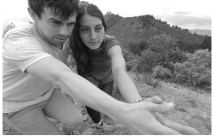
Imagen 3. Grabación de DesTiempo en Chia Cundinamarca, Colombia.

A través de las preguntas ¿dónde sientes qué está tu hogar? ¿para qué recordar? ¿qué son las imágenes? y ¿qué es el tiempo? la pieza buscó mostrar personajes ubicados en lugares en donde a veces se fundían, se mezclaban con su entorno, en el límite de los objetos, de los espacios abiertos y cerrados, de los relatos orales y de las fotografías. Donde esos mismos bordes que los contienen entretejen una posible secuencialidad para reflexionar e interpelar al espectador desde “unos aromas del tiempo que no son narrativos, sino contemplativos, ya que el presente es un punto de transición. Nada es. Todo será. Todo se transforma” Byung-Chul, Han (2015).